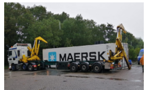
Plaatsing container bij VB. Haaglanden.

MAERSK heeft aan Voedselbanken Nederland gratis enkele koelcontainers voor een half jaar ter beschikking gesteld. Bij VB Haaglanden is de container op 4 augustus geplaatst en ook bij VB Tilburg komt een koelcontainer te staan.