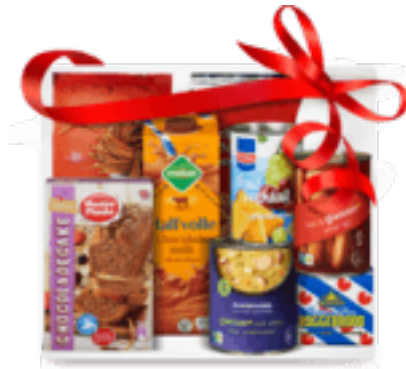
Afbeelding van een Picnic verrassing-pakket Kerst 2018

De succesvolle kerstactie 2018 van Picnic wordt in uitgebreide vorm herhaald. Vanaf 9 december kunnen Picnic klanten online een kerstmaaltijd en/of pakket in hun digitale winkelmand stoppen. De actie