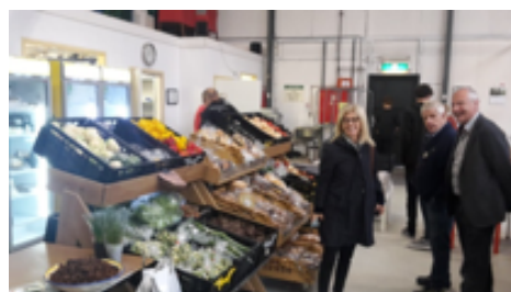
De rijk gevulde "winkel" van Voedselbank Hoeksche Waard.