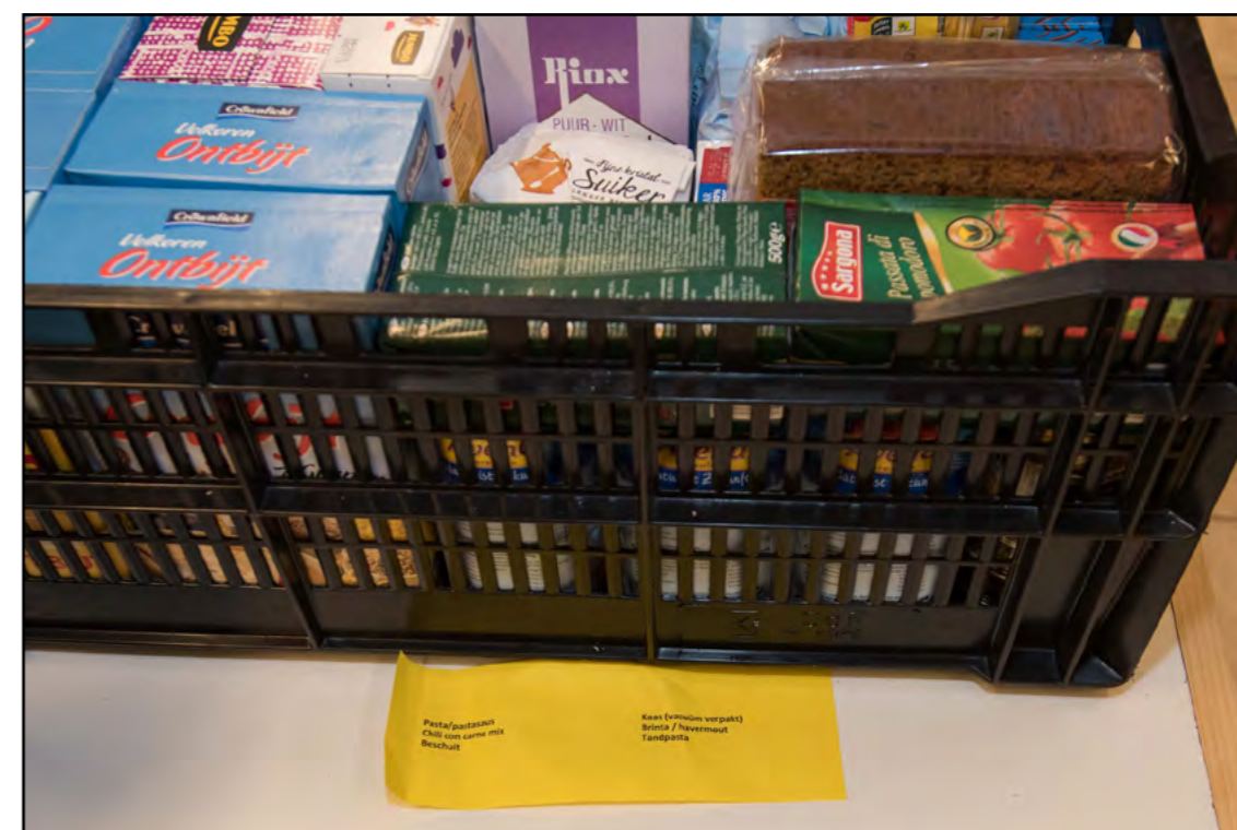
Voedsel inzameling supermarkt.