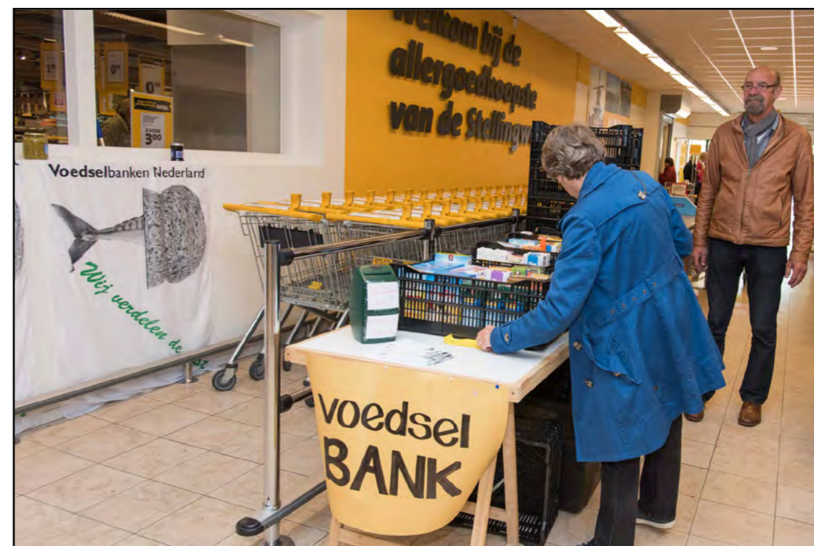
Voedsel inzameling Jumbo.

In 2015 moeten er wellicht een aantal investeringen gedaan worden in het kader van Voedselveiligheid als kunststof pallets, thermometers en meer vriescapaciteit. Het is de bedoeling om deze vanuit de reserves te bekostigen.